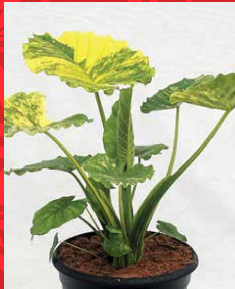
Alocasia Odora 'Variegata Yellow'