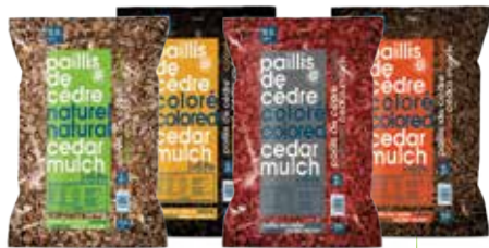
PAILLIS DE CÈDRE 2 pi 3 /56 L