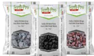
PIERRES DÉCORATIVES 18 kg