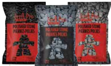
PIERRES POLIES MAJESTIC 10 kg