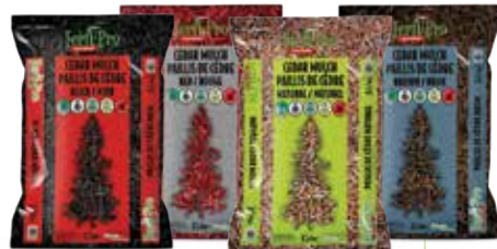
PAILLIS DE CÈDRE 3 pi 3 /85 L