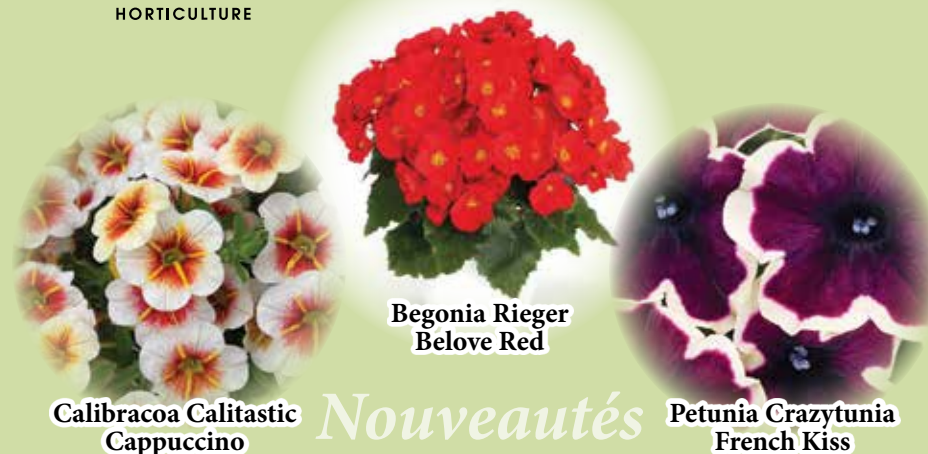
Calibracoa Calitastic Cappuccino

Pour tous vos besoins en boutures! Depuis plus de 40 ANS!